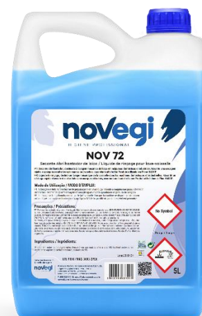
IMAGEM DE PRODUTO