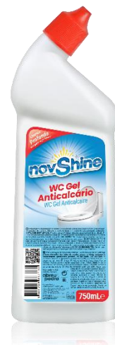
IMAGEM DE PRODUTO

Limpar e puxar o autoclismo. Para melhores resultados deixar atuar o produto durante uma noite.