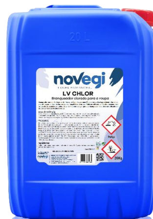
IMAGEM DE PRODUTO