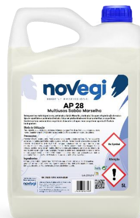
IMAGEM DE PRODUTO

A madeira não tratada não é uma superfície lavável. Em superfícies delicadas aplicar sempre diluído. Em caso de dúvida, experimente primeiro numa zona pouco visível.